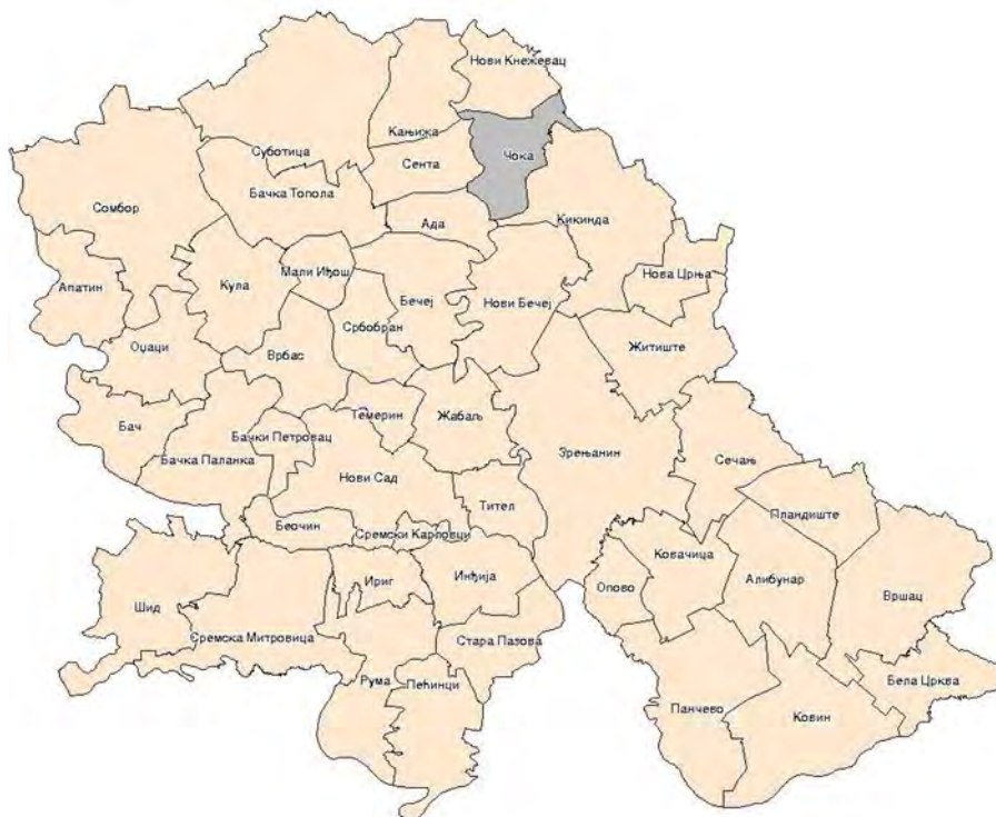
Слика 2. Положај општине Чока 10

седиште и уједно друштвено политички, образовни, здравствени и културни центар општине је насељено место Чока.