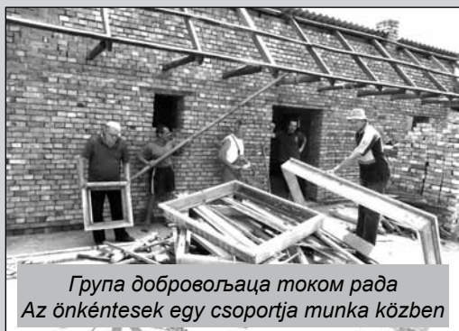
Група добровољаца током рада Az önkéntesek egy csoportja munka közben

A szervezők minden érdeklődőt szeretettel várnak!