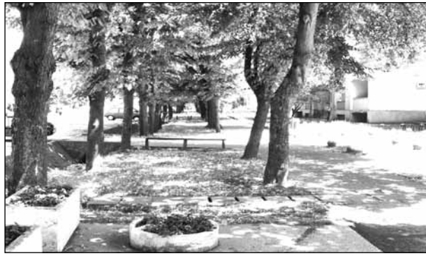
Дворед липа у улици Маршала Тита – Уместо у чај цвет на депонију Hársfasor a Tito marsall utcában – nem teába, hanem személtre kerül a virág

Уместо да се убере и послужи за лек, освежење и зараду, липов цвет са дрвореда у главним чоканским улицама, Маршала Тита и Потиска, задаје посла чоканским комуналцима. Цвет се сасушио, опао и запрљао травњаке и тротоаре, а радници чистоће ЈКП „Чока“ свакодневно га уклањају са улица и износе на градску депонију.