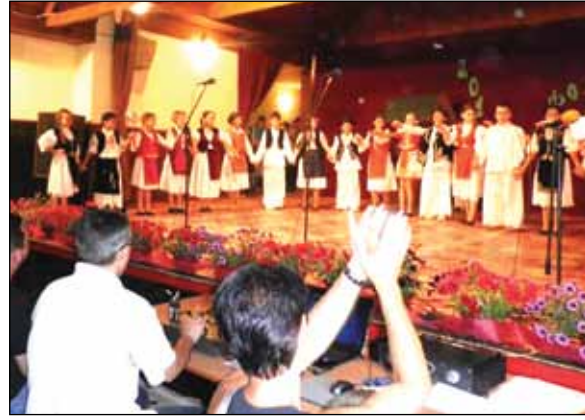
Најмлађи чланови КУД „Др Тихомир Остојић” А Dr. Tihomir Ostojic ME legkisebbjei

Са по две тачке наступили су домаћини и гости из Александрова, док су остали учесници смотре наступали са једном тачком. КУД „Др Тихомир Остојић” угостио је децу из општинских места из Чоке и Санада, али и из других места из околине и даље, као што су Сента, Мол, Српски Крстур, Александрово и два Културно – уметничка друштва из Новог Кнежевца.