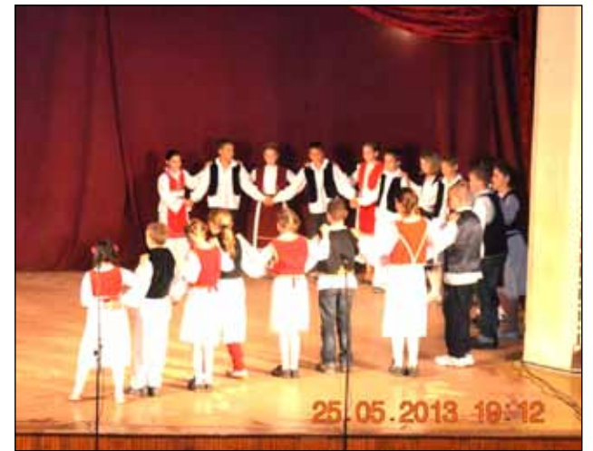
Четврти разред ОШ „Јован Поповић”

Домаћини су се представили најбољим кореографијама на задовољство грађана Чоке, који су и овога пута привржено пратили своје играче. Млађа група и школска секција показали су своје умеће у играма из Баната, а на опште одушевљење публике први ансамбл КУД-а „Свети Сава” у самој завршници премијерно је извео игре из централне Србије.