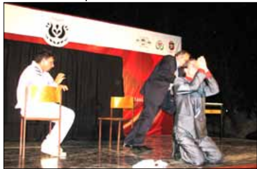
A szajáni Ady Endre Egyesület színjátszóinak A narancs c. előadása

Csütörtök este (június 20-án) aztán megvalósult a nyári színházi katarzis, mert egymást követték a színjátszó csoportok, műfaji gékatat áttörve volt itt minden: népszínmű, performansz, dráma egyaránt. A csókai Móra Ferenc Kék cinkék irodalmi körének tagjai Néha túl sok az élet című mozgásszínházi elemekkel fűszerezte irodalmi összeállítását. A már mérsékelt melegben üdítőként hatott a közönségre az oromhegyesi Hófehérke és a hét törpe című vídám jelenet, ahol a kabaré, mint színpadi műfaj mutatkozott be. A klasszikus meséből átalakított szórakoztató történet egy rádiójáték alapján készült. Lehet ezt még fokozni? – tette fel a kérdést a közönség és velük együtt a soron következő szajáni Ady Endre Művelődési Egyesület színjátszói is, akik az idei Amatőr Színjátszók Szemléjén előadásukért, A narancs c. darabért, közönségdíjat kaptak. A tréfás népszínmű hangulata megbabonázta a csókai közönséget, és az előadás tartama alatt nem volt sem meleg, sem szünyog, legalábbis senki nem panaszkodott. Az estét a magyarkanisai Gondolat – jel színjátszó csoport Faust című előadása zárta. A lélek küzdelmét, a zabolálatlan gondolatok kusza világának impozáns kivételését láttuk ezeknek a fiataloknak az előadásában. Mély, megindító, megrázó, eredeti és elgondolkodtató volt az előadás. A máról szolt, egyszerűen és elegánsan a létező és valós problémákról.