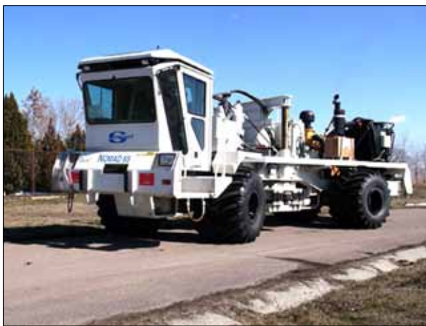
Уређај за сеизмичка испитивања Földrengés-kutató berendezés