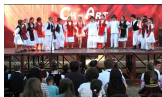
Nastup KUD-a „Dr Tihomir Ostojić“ iz Ostojiћeva

од првог до четвртог разреда која нам је приказала игре из Баната. Свака част и једним и другим младим глумцима који су нас разигralи и обрадовали својим умећем!