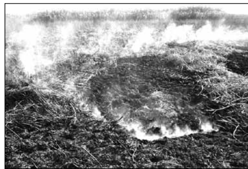
Горућа депонија у Великом риту – Смрди, али није штетно!

ма/м 3 а највише измерена је мања 0,001 микро-грама/м 3 – износи податке инспекторка Клиска. Када је у питању депонија у бившој „Радовој“ циглани, она каже да Фабрика шећера „ТЕ-ТО“ Сента користи деградирани постор површинског копа некадашње циглане за одлагање отпада од прања и чишћења шећерне репе. За горе наведени простор фабрика шећера „ТЕ-ТО“ Сента поседује пројекат рекултивације из 2007. године. - Пројекат садржи све неопходне мере и радње које доприносе да одлагање отпада задовољава законом прописане критеријуме. На пројекат рекултивације добијена је сагласност од Министарства животне средине и просторног планирања 2008. године. Шећерана је поднела Покрајинском секретаријату за заштиту животне средине и одрживи развој, како Закон о процени утицаја и налаже,