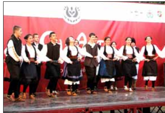
Nastup KUD-a „Свети Сава“ из Чоке

У петак 21. јуна XII летње дане уметности у Чоки затворила је одлична представа „Бесни Теофило“ у извођењу чланова КУД-а „Башаид“ из Башаида. Млади глумци аматери одиграли су комедију по истоименој приповеци Бранислава Нушића, насмејали нас, забавили и показали како некад несрећна околност може да донесе позитиван исход.