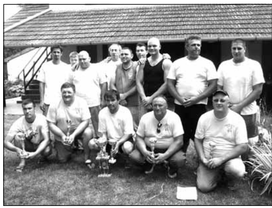
Свеукупни победник – екипа из Санада Аз összesített győztes – а szanádi csapat

Домаћин Сабора ловаца, који четврти пут приређују чланови Ловачког удружења „Дропља“ из Чоке, били су ловци из Санада. Јединствен скуп ловаца, када се не организују хајке нити лови дивљач, а пушке се користе само за гађање глинених голубова, протекао је у дружењу 300 ловаца из Чоке, Црне Баре, Остојићева, Врбице, Јазова и Санада и гостију из околних удружења, који су се, поред гађања глинених голубова, надметали у потезању конопца и кувању срнећег гулаша.