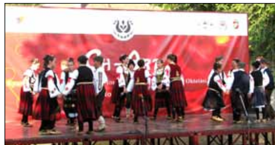
Nastup KUD-a „Vuk Karadžić“ iz Sanada

Prvog dana, nakon predstave „Miševi“, upечатljiv i originalan zabavni program za