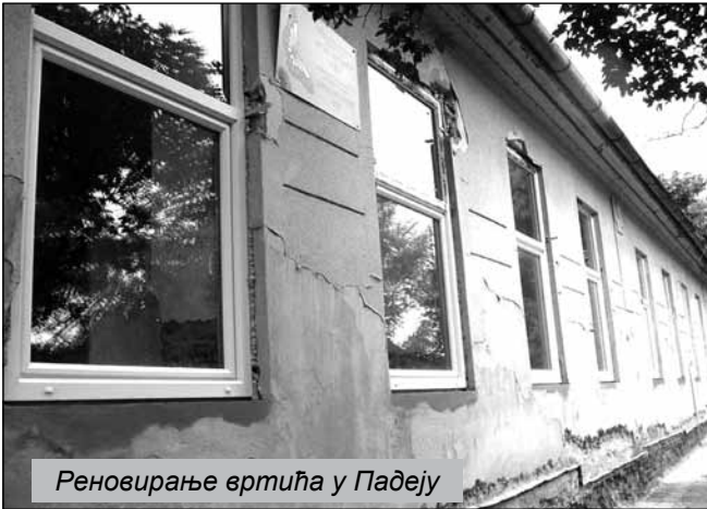
Реновирање вртића у Падеју

замене је PVC столаријом, која се показала као један од најбољих начина да се у зимским данима сачува топлота, као и да се смање трошкови грејања, олакша одржавање хигијене и допринесе естетском уређењу просторија и објекта. Да би урађена хидроизолација имала потребан ефекат, потребно је извесно време како би се зидови током лета осушили природним путем. Очекује се да ће до почетка наредне школске године просторије бити оспособљене за боравак деце.