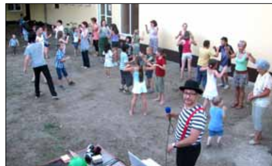
Ekipa „Kreativnog pogona“ na delu

Program je bio šarenilik i prilagođen svima, kako najmlađima tako i starijoj populaciji. U periodu od 18-21. juna građani su mogli posetiti izložbu slika, gledati predstave, slušati horove, uživati u nastupima kulturno-umetničkih društava ili prirediti deci pravu zabavu uz odličnu animaciju.