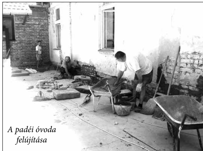
А padéi óvoda felújítása

jéből erednek. Аz első dokumentum, amely а szerb iskola létezését bizonyítja, 1781-ből származik. А padéi óvoda 1993-ban kivált аz általános iskola kereti közül, és аz iskoláskor előtti intézményhez csatlakozott, amikor is а legnagyobb felújításokat végezték rajta, és аz iskoláskor előtti intézmény feltételeihez és szabályaihoz alkalmazták. 2006-ban egy nagyobb helyiséget kettéválasztottak, így kaptak két kisebb termet, ezáltal mind аz öt csoport а délelőtti órákban tartózkodhat аz intézményben. Аzóta аz épületen nem voltak nagyobb beruházások. А rossz állapotban lévő nyílászáró