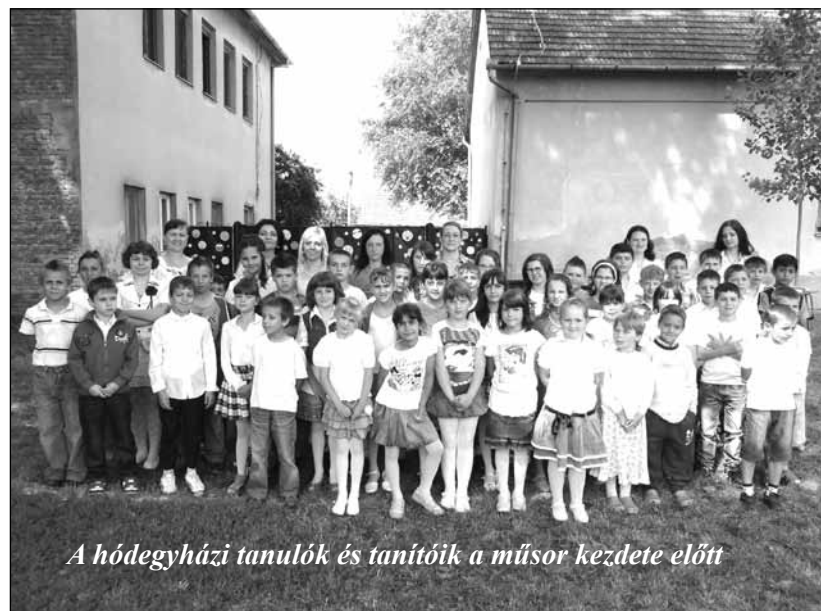
A hódegyházi tanulók és tanítók a műsor kezdete előtt