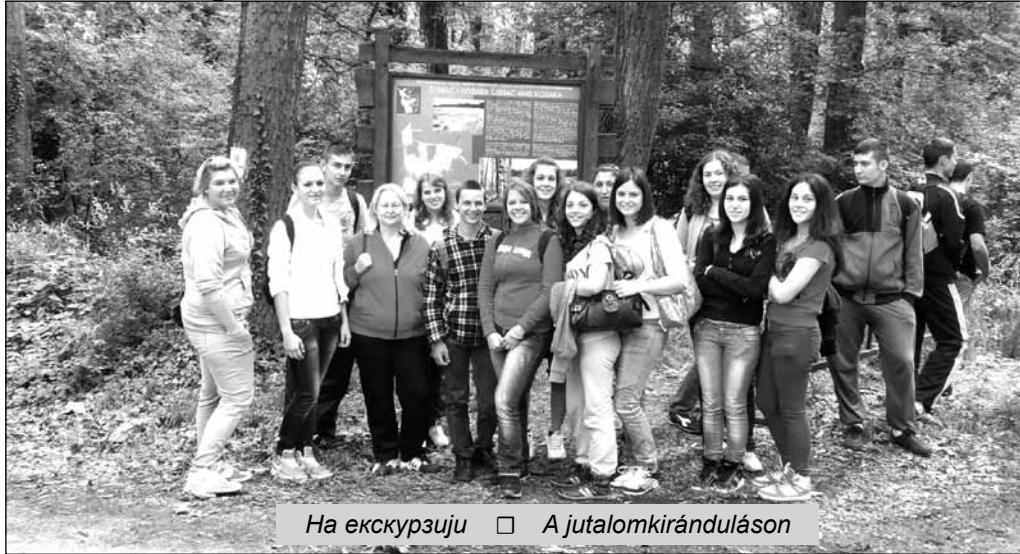
На екскурзију □ А јуталомкирандулосон

Хемијско-прехранбена средња школа у Чоки је добила признање за одличне резултате остварене у оквиру програма „За чистије и зеленије школе у Војводини“, чији је циљ изградња еколошке свести у васпитним установама.