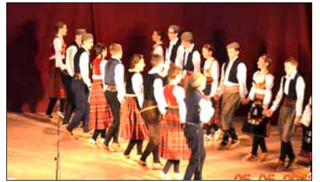
Први ансамбл КУД-а „Свети Сава”

25. маја на сцени Дома културе у Чоки одржана је манифестација под називом „Вече фолклора”. И овог пута Културно-уметничко друштво „Свети Сава” из Чоке, заједно са својим гостима, приредило је грађанима догађај за памћење.