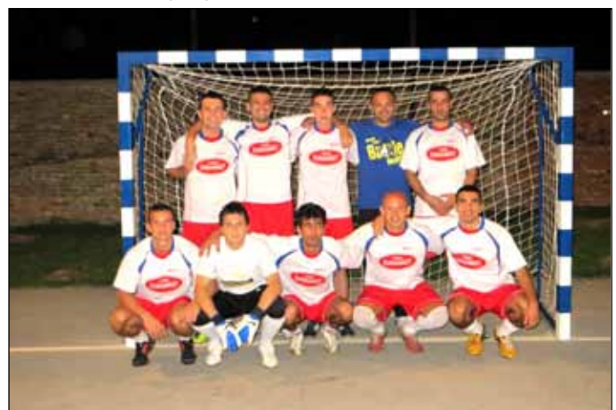
Победници „Неофарм“ лиге малог фудбала