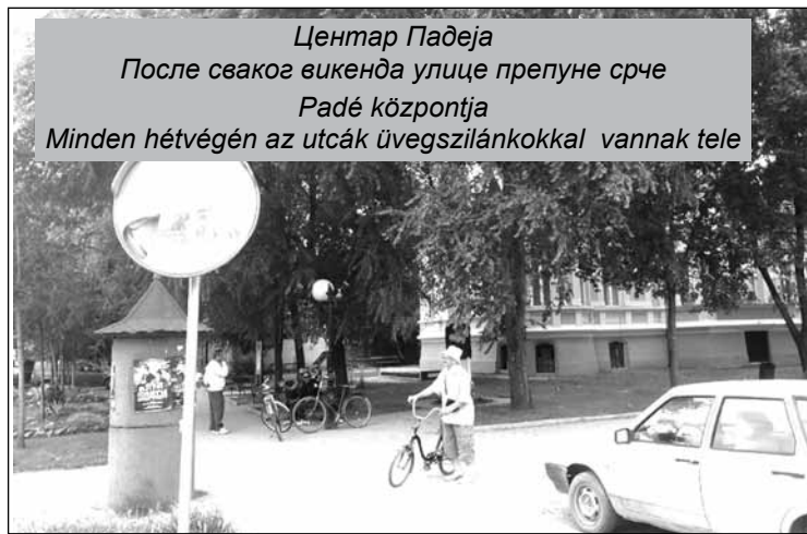
Центар Падеја После сваког викенда улице препуне срце Padé központja Minden hétfőn az utcák üvegszilánkokkal vannak tele

Житељи Падеја жале се и на бајкере који из оближње Аде долазе да вежбају, испробавају своје моторе и великом брзином возе кроз сеоске улице. – У Ади постоји полицијска станица и саобраћајна полиција, па тамо не смеју да се иживљавају, већ преко моста на Тиси долазе у Падеј, где саобраћајци из ПС Чока само повремено навраћају – каже мештанин који не жели да се представи, јер се плаши, како рече, „концрта“, који могу да приреде бајкери испред његове куће.