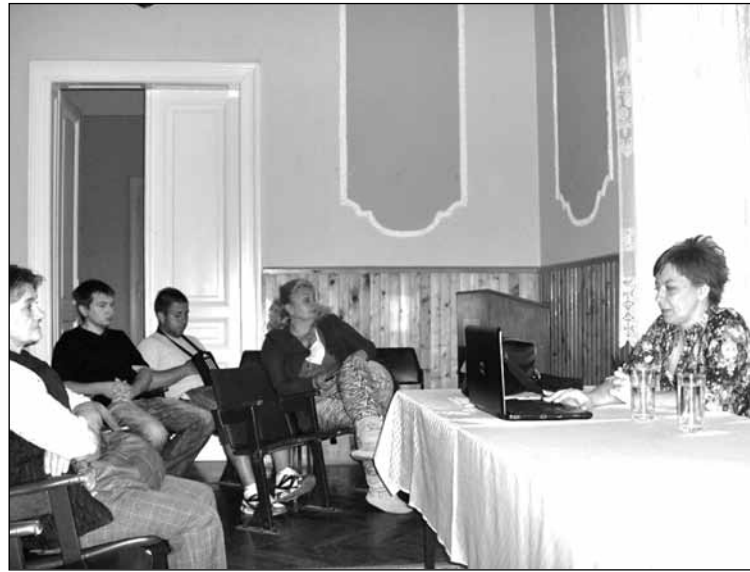
Покрајински омбудсман у разговору са мештанима Падеја A tartományi ombudsman a padéiakkal beszélget