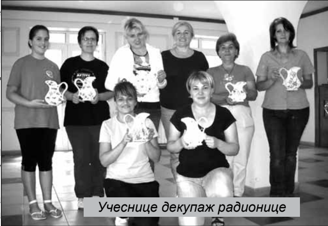
Учеснице декупаж радионице