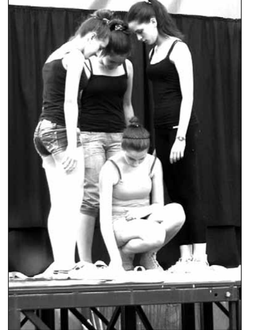
A Kék cinkék négy tagja a Ch-Art Napok rendezvényen

előadások mellett a nemezelés, gyöngyfűzés, agyagzás fortélyaival ismerkedtek, szabadidejükben pedig kulturális, népművészeti és gasztró hagyományait mutatták be egymásnak.