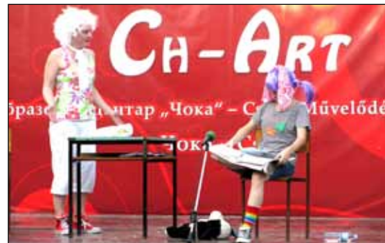
Представа за децу „Заврзлама“

Истог дана у извођењу Удружења „Радионица снова“ из Новог Бечеја одиграна је занимљива позоришна представа за децу